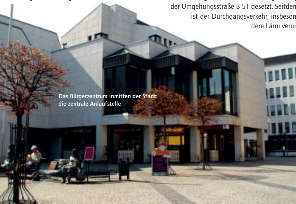
Das Bürgerzentrum inmitten der Stadt: die zentrale Anlaufstelle

Man muss kein Müller sein, um in Wermelskirchen Lust aufs Wandern zu bekommen. Umgeben von drei Trinkwassertalsperren und herrlicher Natur direkt vor der Haustür, ist die Stadt