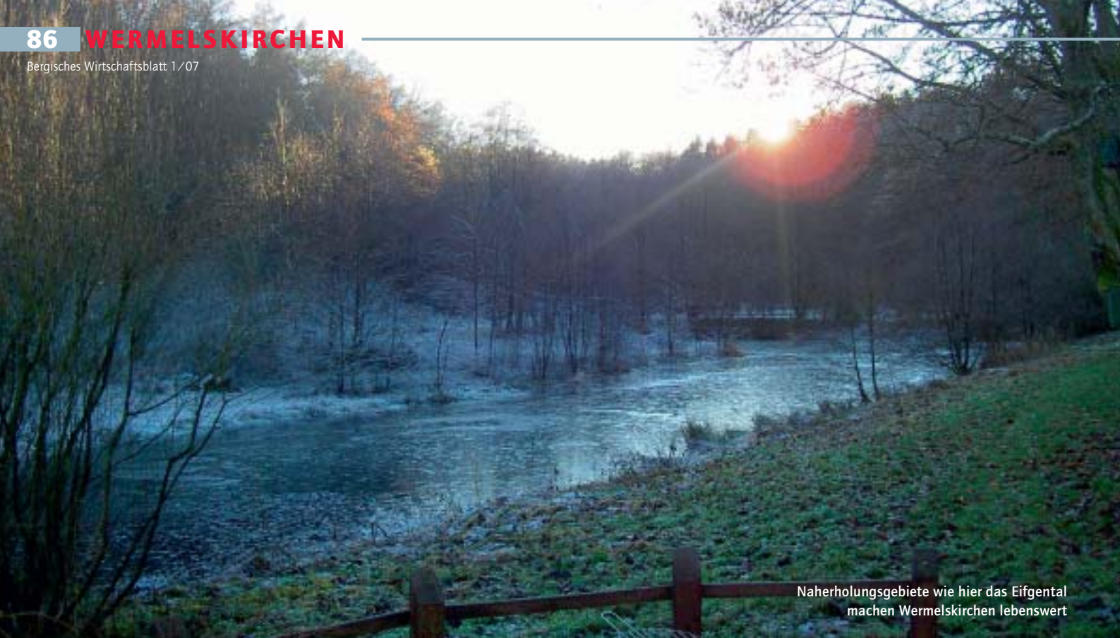
Naherholungsgebiete wie hier das Eifgental machen Wermelskirchen lebenswert

und Gewerbe bietet die City ein Ambiente, das viele Besucher anlockt. Denn Wermelskirchen ist ein Städtchen wie aus dem Bilderbuch. In der malerischen Innenstadt, die durch einen Großbrand im Jahre 1758 fast völlig zerstört und danach wieder aufgebaut wurde, sorgen liebevoll restaurierte Fachwerkbauten für ein besonderes Flair. Zu den markanten Sehenswürdigkeiten zählen unter anderem die Bürgerhäuser an der Eich, in denen das Standesamt und das Stadtarchiv untergebracht sind; aber auch das Ensemble „Am Markt“ in der Nähe der evangelischen Stadtkirche gehört zu den Kleinoden altbergischer Architektur.