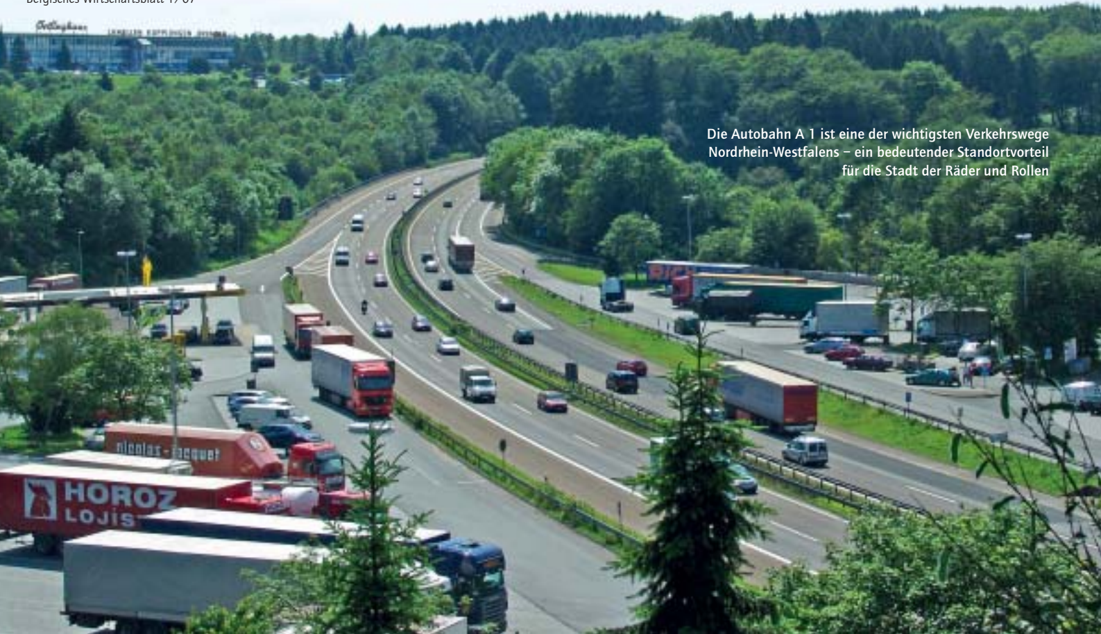
Die Autobahn A 1 ist eine der wichtigsten Verkehrswege Nordrhein-Westfalens – ein bedeutender Standortvorteil für die Stadt der Räder und Rollen

sich im Umkreis von 70 Kilometern und sind über die Autobahn schnell zu erreichen. Ebenso zählt die gute Infrastruktur Wermelskirchen mit vielfältigen Bildungseinrichtungen, einer ausgezeichneten medizinischen Versorgung, einem breitgefächerten Kulturangebot sowie kundenfreundlichen Einkaufsmöglichkeiten zu den Pluspunkten des neuen Gewerbestandorts.