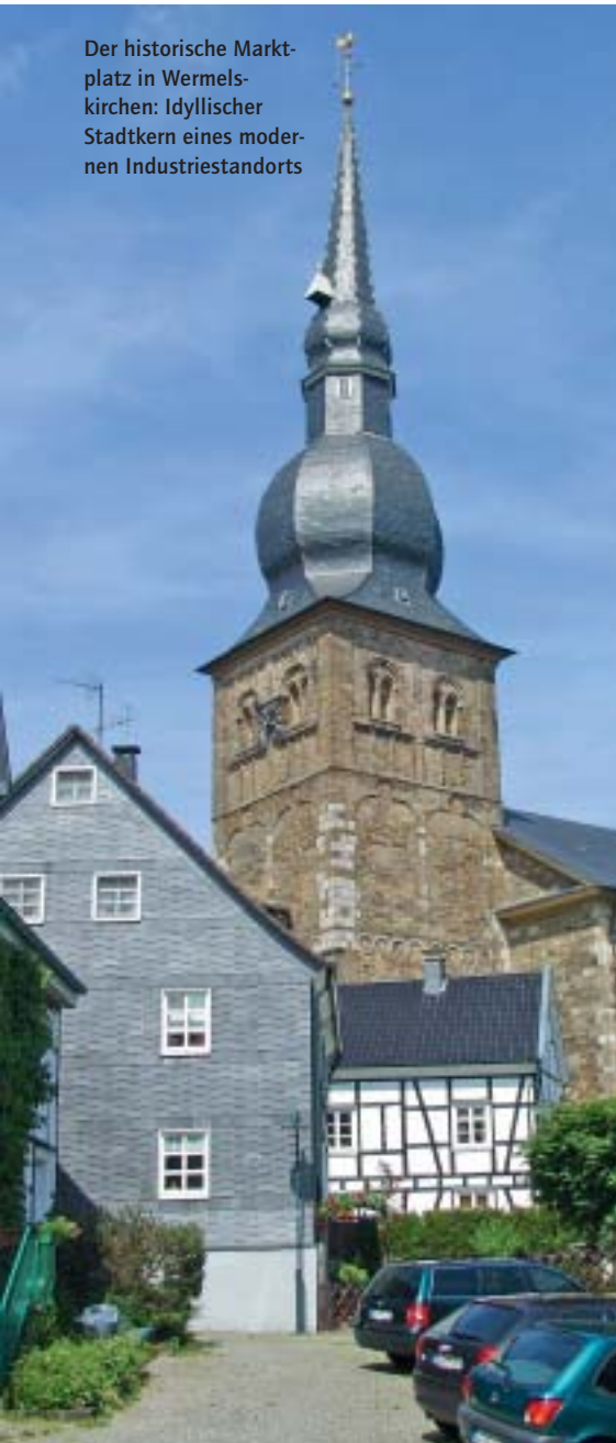
Der historische Marktplatz in Wermelskirchen: Idyllischer Stadtkern eines modernen Industriestandorts

Wie im neuen Unternehmenspark Ostringhausen (siehe Kasten) treffen am Standort Wermelskirchen zahlreiche Faktoren zusammen, um hochwertige, zukunftssichere Arbeitsplätze zu schaffen. Mitten im Grünen und doch ganz nah an den Metropolen von Rhein, Wupper und Ruhr. Die Flughäfen von Dortmund, Düsseldorf und Köln/Bonn befinden