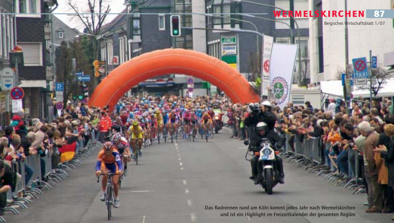
Das Radrennen rund um Köln kommt jedes Jahr nach Wermelskirchen und ist ein Highlight im Freizeitkalender der gesamten Region

ein Eldorado für Trekking-Freaks. Über 200 Kilometer ausgewiesene Wanderwege führen zu Ausflugszielen in die nähere und weitere Umgebung, zum Beispiel ins verwunschene Eifental, zum Altenberger Dom oder an die Große Dhünntalsperre, die mit einem Stauinhalt von 81 Millionen Kubikmetern das zweitgrößte Trinkwasserreservoir Deutschlands bildet.